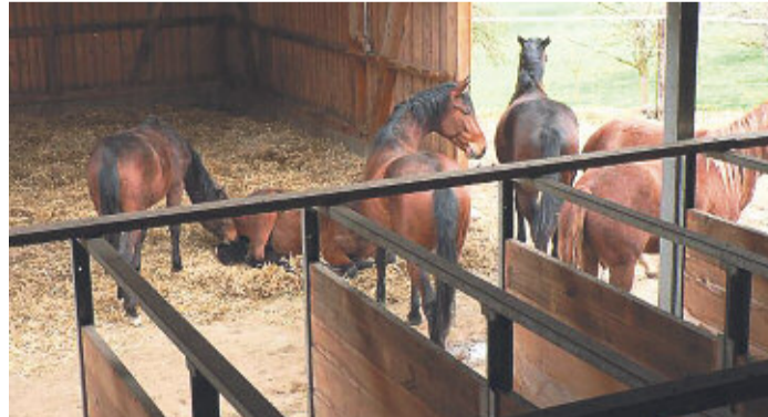
Die zwölfseitige Broschüre Agroscope Transfer Nr. 36 kann auf www.agroscope.ch gratis heruntergeladen werden.

Die grössten Herausforderungen für eine zeitgemässe Pferdehaltung liegen deshalb im Fütterungsmanagement, in der baulichen Gestaltung und im Management von Gruppenanlagen sowie in der Optimierung des häufigsten Aufstallungssystems für Pferde, der Einzelboxenhaltung. Lösungsvorschläge haben nur dann eine Breiten-