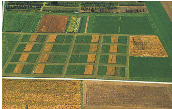
DOK-Versuch in Therwil: Die gängigen Schweizer Bewirtschaftungsverfahren mit Hofdünger erzeugen im Boden Lebensgemeinschaften mit ähnlichen Mikroorganismen.

Im internationalen Vergleich zeichnet sich die Schweizer Landwirtschaft aus durch eine geringere Spezialisierung und eine gemischtbetriebliche Organisation, die Tierhaltung und Pflanzenbau verknüpft und damit auf Hofdünger wie Gülle und Mist setzt. Die Schweizer Verfahren gemäss den Richtlinien des ÖLN mit Hofdünger und des biologischen Landbaus erzeugen im Boden also einen Lebensraum