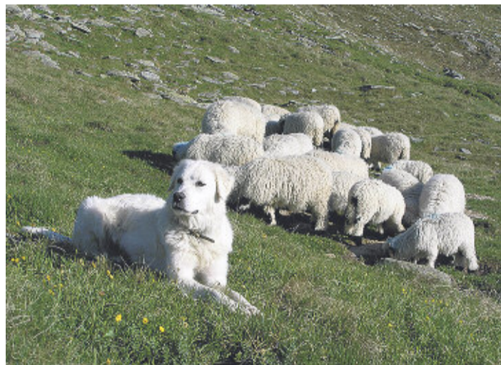
Hoffentlich bleibt der Alpsommer 2015, wie dieses Bild es vermittelt.

Die meisten Alperverantwortlichen wissen wohl, was es zu beachten gilt – trotzdem seien hier ein paar Punkte erwähnt. Auch auf den Sömmerungsbetrieben gilt die Aufzeichnungspflicht für Tierarzneimittel . Das Behandlungsjournal ist stets zu aktualisieren. Werden Tierarzneimittel auf Vorrat bezogen, muss für den Sömmerungsbetrieb eine Tierarzneimittelvereinbarung mit dem Tierarzt abgeschlossen werden. Der Tierarzt muss in diesem Falle mindestens einen Betriebsbesuch während der Sömmerungsperiode durchführen.